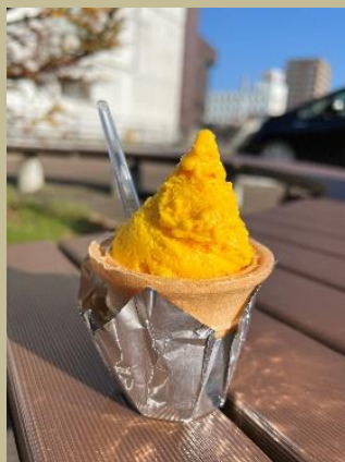
・金山赤カボチャ