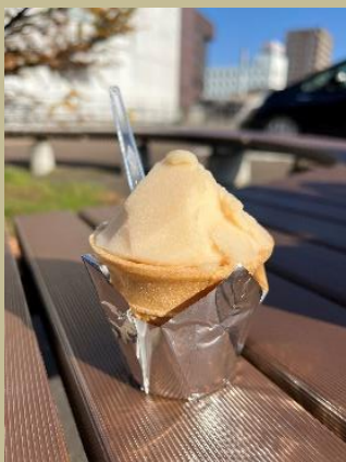
・福島産桃のシャーベット